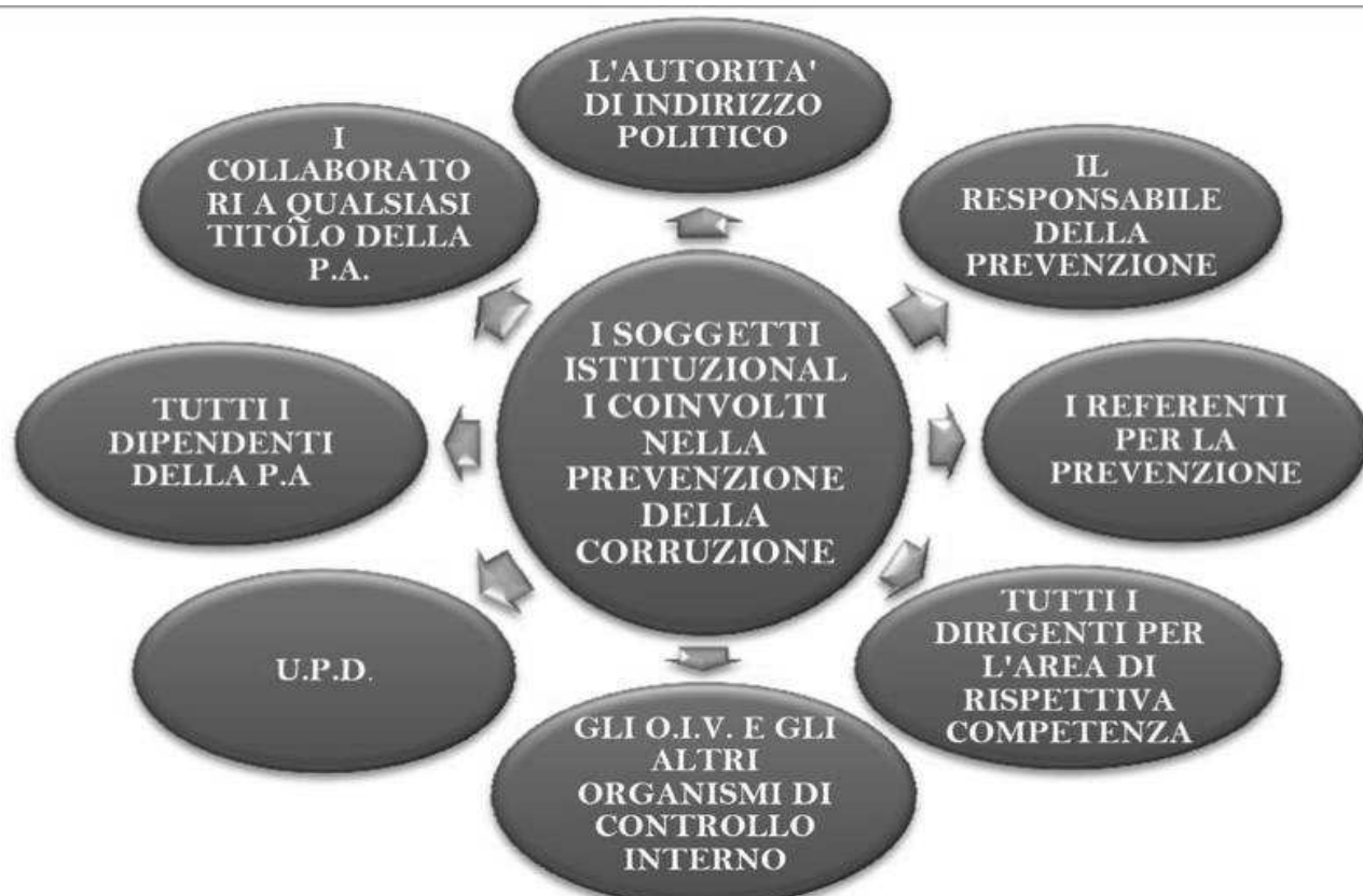
Soggetti coinvolti nell'elaborazione del Piano triennale della prevenzione della corruzione

I soggetti destinatari sono tutto il personale a qualsiasi titolo occupato presso l'amministrazione capitolina. I dirigenti e il personale alle dipendenze del Comune di Gaeta sono tenuti ad assicurare la collaborazione all'attuazione del Piano, adempiendo alle disposizioni e alle attività previste, secondo gli indirizzi e le indicazioni tecnico-operative definite dal Responsabile della Prevenzione della Corruzione. I Dipartimenti competenti a tal fine dovranno inserire nei contratti di servizio con le società partecipate specifici obblighi in merito agli adempimenti in materia di prevenzione della corruzione, prevedendo in essi, in caso di inottemperanza, specifiche sanzioni per l'Azienda e gli Amministratori sulla base di determinati indirizzi approvati dall'Amministrazione